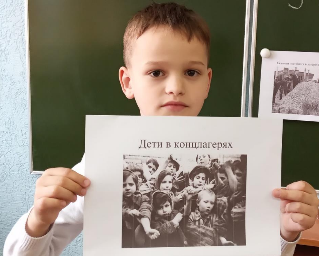
Дети в концлагерях